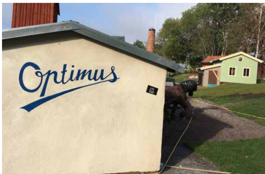
TEMAPARKEN WÄSBY VERKSTÄDER. Socialdemokraterna vill gärna se ytterligare en temapark.

Upplands Väsby arrangerar sommaraktiviteter på hemmaplan. Vi tror att barn också behöver se nya platser. Alla barn har inte tillgång till ett landställe eller råd att resa bort. Socialdemokraterna vill att kommunen undersöker intresset för sommarkollo bland kommunens barn och föräldrar, samt undersöker förutsättningarna för att erbjuda sommarkollo.