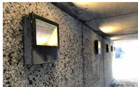
Väsby's tunnlar behöver omtanke.

Idag låter kommunen endast sanera det klotter som är felanmält. Om en yta är klottrad någon meter därifrån lämnas den därhän. Det är oacceptabelt. Kommunen behöver jobba på ett mer effektivt sätt som innebär att den som sanerar tar bort allt klotter den ser när den kommer till platsen.