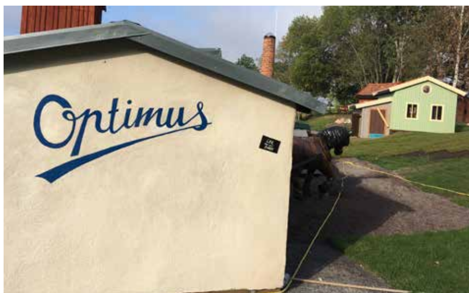
TEMPARKEN WÄSBY VERKSTÄDER. Socialdemokraterna vill gärna se ytterligare en tempark.

Socialdemokraterna vill etablera projektet Boken kommer. Det är en service till invånare som på grund av exempelvis hög ålder, långvarig sjukdom, rörelsehinder eller funktionsnedsättning inte själv kan komma till biblioteket. Exakt hur vi skulle kunna arrangera Boken kommer i Väsby är inte det viktiga. Fokus är i stället på att göra böcker och läsning tillgängligt för fler än idag.