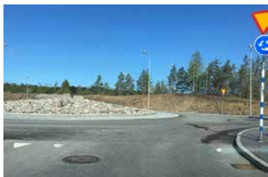
Vita strecken behöver bli vita.