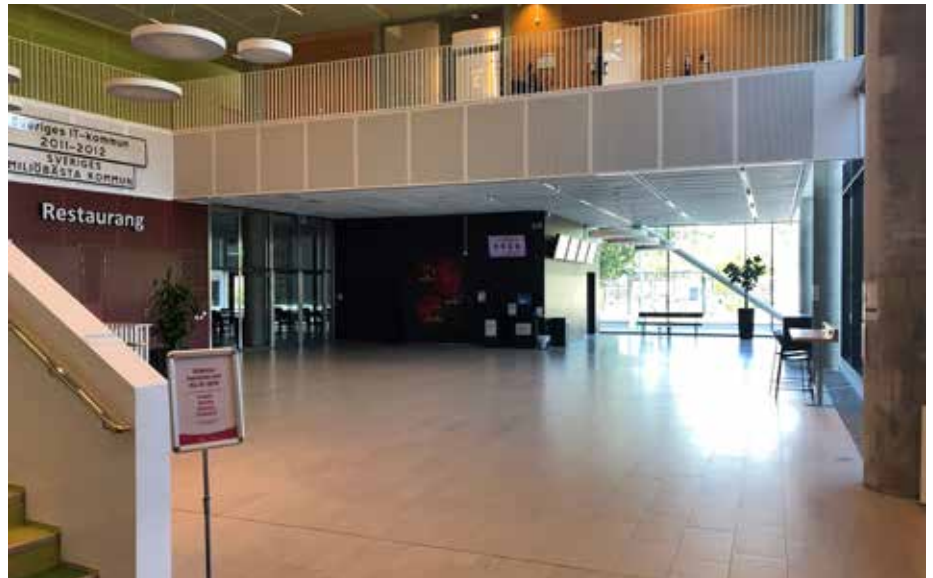
MESSINGENS FOAJÉ. Plats för seniorverksamhet?

Vi vill att kommunen undersöker möjligheterna att upplåta den